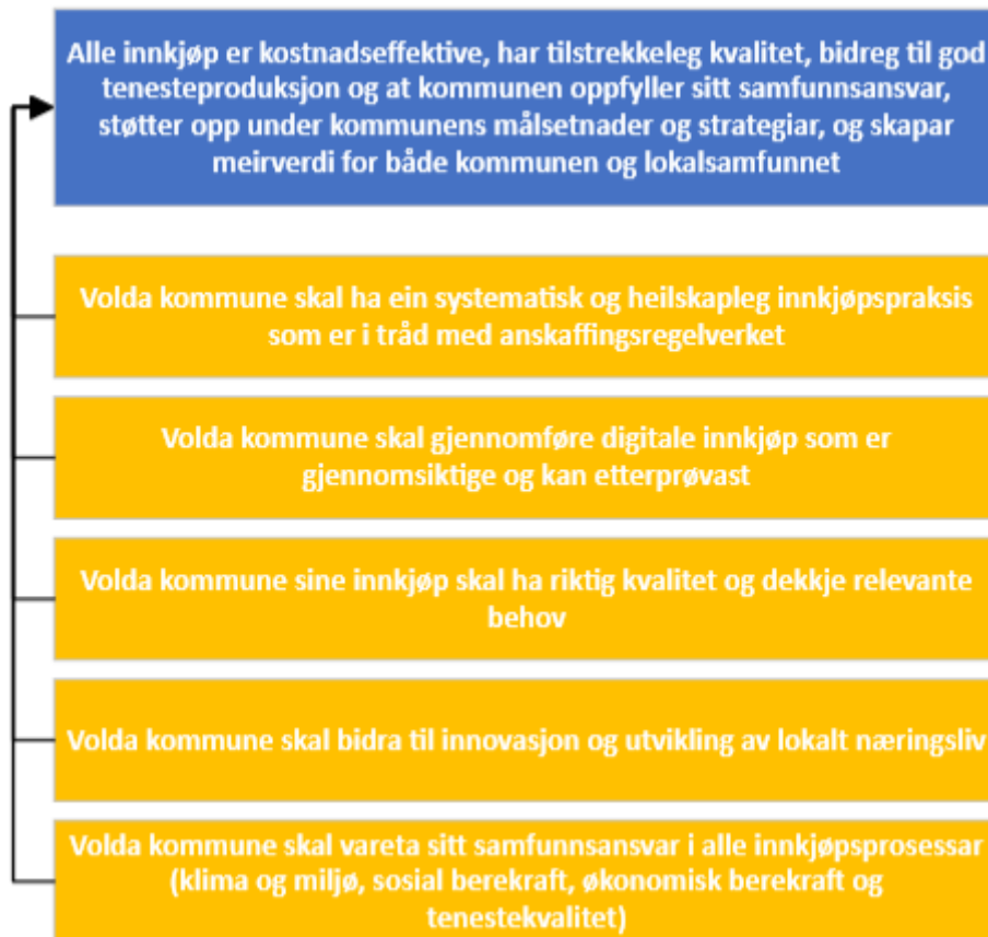
Figur 1: Oversikt hovudmål og delmål

For å oppnå denne ambisiøse, men realistiske visjonen/hovudmålet består innkjøpsstrategien av fem konkrete delmål som beskriver ønskja målbilete og tiltak som skal føre kommunen dit. Delmåla tek for seg ulike sider av innkjøpsarbeidet: