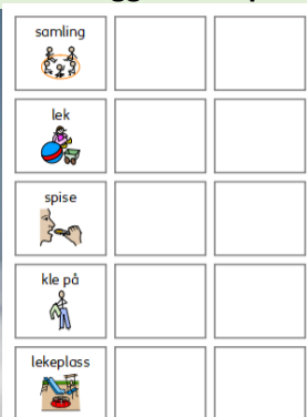
Foto og illustrasjonar frå statped.no på korleis ASK kan sjå ut i barnehagen. Døme på deler av dagsplan og tilgjengelege tematavler til daglege aktivitetar.